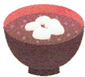
ぜんざい・苗木配布