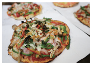
▲贅沢なトッピングのピザ