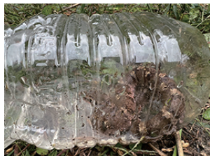
▲捕獲されたマムシ

一番上の田んぼは水が少なく作業はしやすいのですが、マムシも住みやすいとみえて、稲刈り作業中に姿を表しました。注意が必要です！