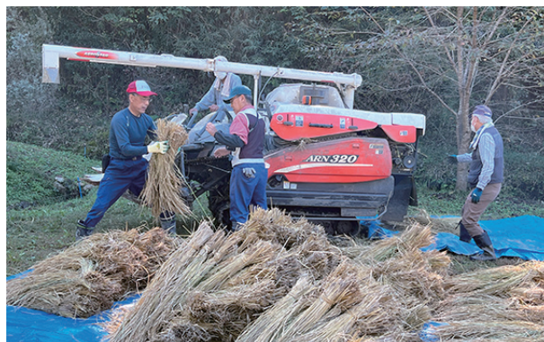
▲次々と脱穀機に稲を投入