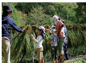
▲ハザ掛けも体験しました