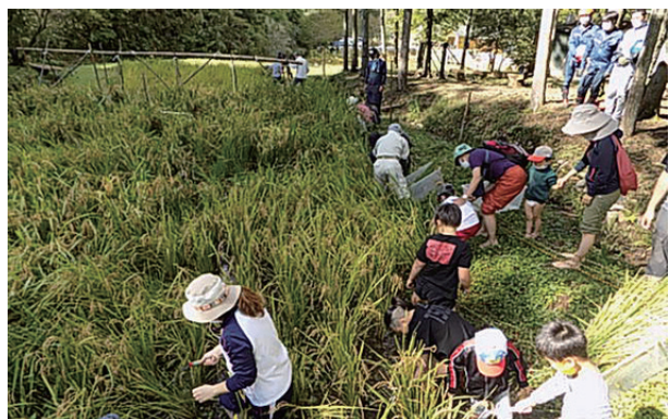
▲初めは、裸足で入る田んぼにおっかなびっくりの参加者の皆さん