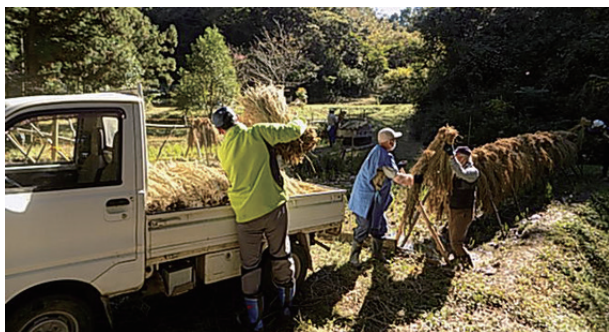
▲まずは、ハザから干した稲を脱穀機の周辺に運びます