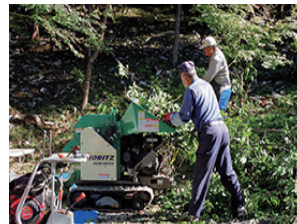
▲チップパーで粉碎処理

他のチームは、収穫したお米を乾燥させるため天日干しです。天日干しには、絶好の日和です。