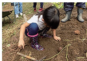
▲本気で素手で芋を掘ります