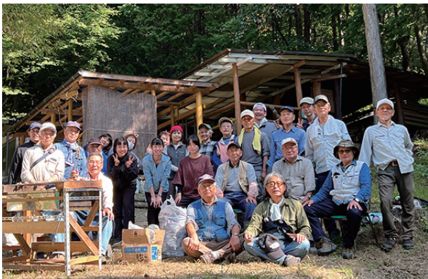
▲収穫祭に集まった会員の皆さん