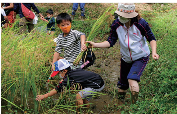
▲お兄ちゃん頼もしいですね