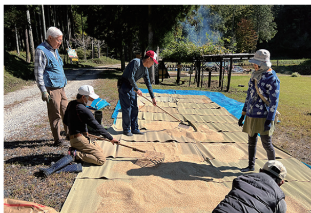
▲今年のお米は質が良さそうです

急に寒くなったので早速、薪の注文が入りました。午後からは、薪の出荷準備を行いました。