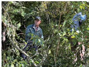
▲刈った枝を集めます

雲一つない秋晴れです。先日、日照改善に剪定したカシノキのチップ処理を行いました。