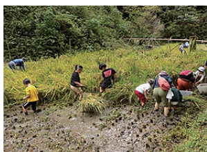
▲どんどん刈り進みます