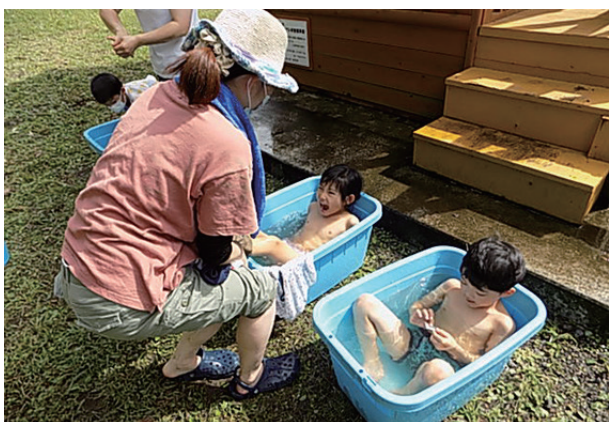
▲我田の森温泉に浸かってほっこりする子供達

お昼は、里山名物冬瓜汁と塩むすびを賄いにご用意しました。質素ですが滋味あるれる食事です。みなさんお腹いっぱいいただきました。