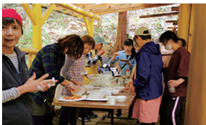
▲賑やかなピザグループ