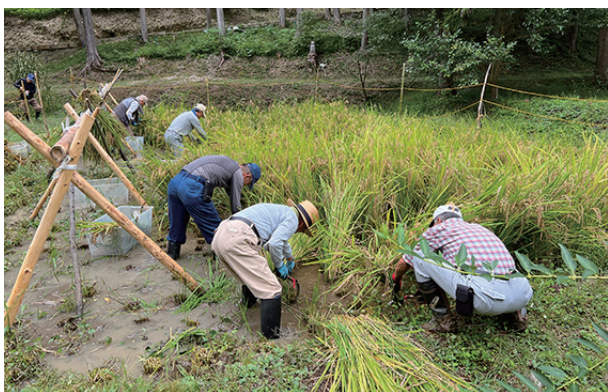
▲いよいよ稲刈りの始まりです

メインの活動は、田んぼ2枚の稲刈りです。意外に時間がかかり、ハザ掛けの追加設置も合わせ、午前中フルの作業となりました。