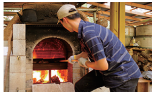
▲既にピザ焼き職人の風格