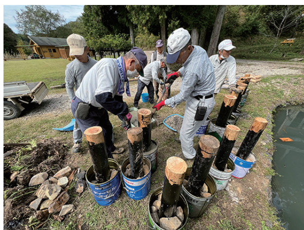
▲ペルー缶に支柱を入れコンクリートで固めます

14本の支柱が完成しました。1本の重量は30kg~40kgはありそう。どうやって誰が運ぶんでしょうね。