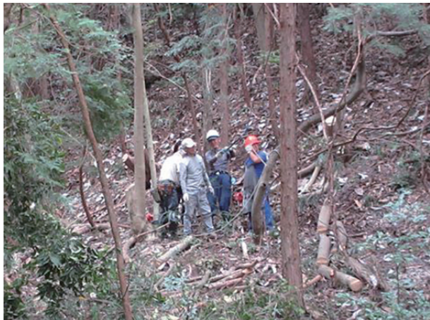
▲駐車場下の谷で作業の打ち合わせ

この日も晴れ、夏日となりました。寒暖の差が激しい今日この頃です。こどもの庭の父兄も参加していただきました。しかし、稲刈りも終わり脱穀までこれといって急ぐ作業もなく、各々がそれぞれの活動を行いました。