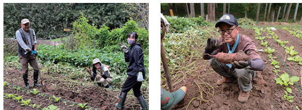
▲里山ファームで「サツマイモ」掘り

午後からは、サツマイモ掘り、芝生広場の手入れ、ピオトープ池の橋修理と活動満載の1日となりました。