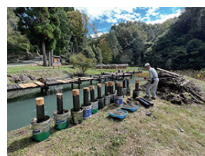
▲支柱も並ぶと壮観です