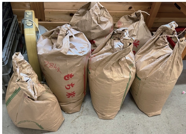
▲収穫されたお米は管理棟で保管

昨年はニホンカモシカの被害をうけ、収穫が減りましたが、今年はトラロープを柵田に張り巡らせ、大切に稲を育ててきたのです。その甲斐もあって被害を防ぎもお米を収穫することができました。総量 130kg のもち米を収穫することができました。