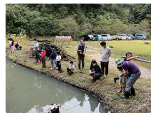
▲ザリガニも大量に捕獲・駆除

午後からは、サツマイモ掘り体験とお約束のザリガニ釣りで存分に里山の秋を満喫していただきたいと思います。12月には収穫した餅米でお餅つきをする予定、里山での再会を約束しましたあ!