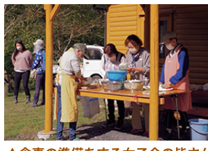
▲食事の準備をする女子会の皆さん

お昼は、里山名物冬瓜汁と塩むすびを賄いにご用意しました。質素ですが滋味あるれる食事です。みなさんお腹いっぱいいただきました。