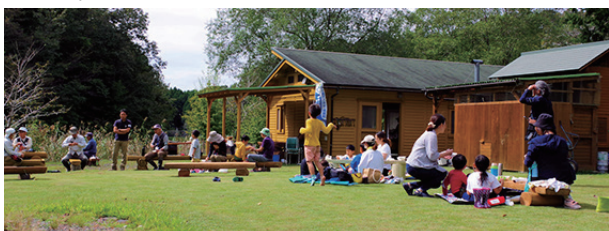
▲ゆったりと里山のお昼休みを満喫中