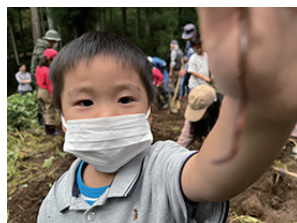
▲ミミズだってへっちゃらい!