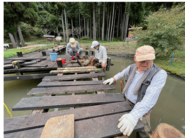
▲不安定な足場、池の中で格闘する橋の修理