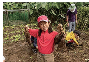
▲大きなサツマイモを収穫