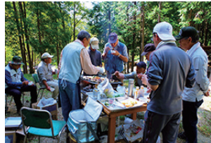
▲スペシャル BBQ に舌鼓