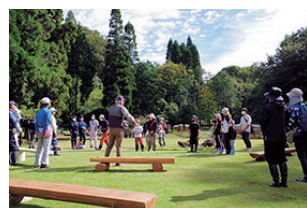
▲清々しい朝、始まりの会

天候が目まぐるしく変わる日々ですが、この日はピンポイントで快晴の1日となりました。一般参加者を迎え稲刈りをする絶好の日和です。早速、稲刈りのスタートです。