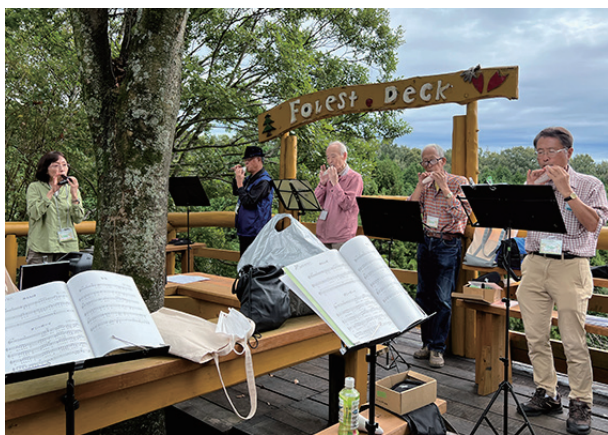
▲優しいオカリナの音色が森に響きます

この日は、今月から我田の森の仲間に加わった「オカリナ 森のハーモニー」さん達の初の練習日です。12名の参加者で大盛況。みなさん森での豊かな練習に感激とのことでした。