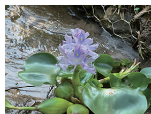
▲水路の脇で花を咲かすホテイアオイ